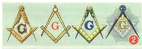
Gambar 10: Jangka Pengukur

Pada tahun 1999 ini, mereka sendiri yang akan menyulut kekacauan agar memudahkan jalan bagi mereka mengisi perbaikan dunia menuju "reformasi milenium baru". Simbol-simbol setan tersebut antara lain berbentuk sebagai berikut: